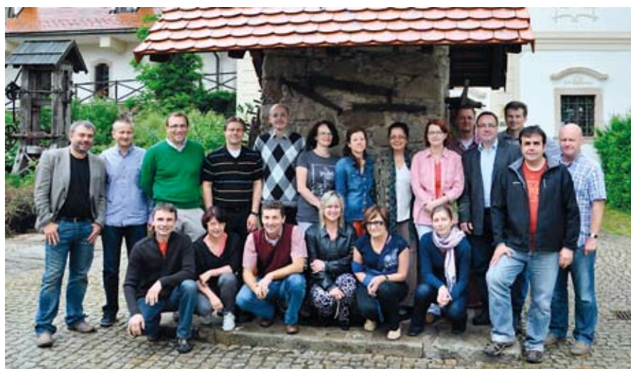
Obr. 3. Pracovní skupina pro idiopatické střevní záněty ČGS, 8. 6. 2012.

Anémie je nejčastější extraintestinální manifestací IBD, významným způsobem alteruje kvalitu života pacientů. Hlavními typy anémie u IBD jsou anémie hypochromní a anémie chronických chorob (anémie chronického zánětu) a jejich kombinace. Ostatní typy chudokrevnosti jsou podstatně vzácnější, zahrnují zejména makrocytární a polékovou anémii. Základními patofyziologickými rysy hypochromní anémie jsou porucha resorpce železa, porucha uvolňování železa retinovaného v makrofázích a chronické krevní ztráty způsobené rekurentním makroskopickým nebo mikroskopickým krvácením ze zánětlivě změněné sliznice. V patogenezi anémie chronického zánětu hrají hlavní roli prozánětlivé mediátory ovlivňující všechny stupně erytropoézy.